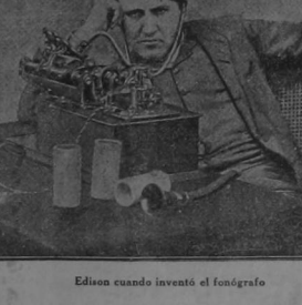
Edison cuando inventó el fonógrafo

Con la inmensa energía que siempre tuvo su carácter, estudió veinte horas diarias y en cuatro meses era un consumado telegrafista. Como