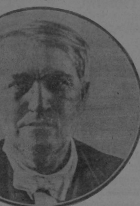
Ultimo retrato de Edison

Después de haber a él mismo: «Después de la batalla de Pittsburgh.