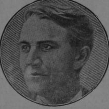
Edison a los 35 años

Un tiempo después tomó a su servicio dos vendedores de periódicos al pregon los cuales no dormían por la noche; para que pudieran dormir en el día, Edison compró una botella de parafina y los hacía tomar una cucharada diariamente: «fué la primera vez—dice el gran hombre—que combiné la ciencia con el negocio.» fué al primer éxito.