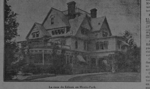
La casa de Edison en Menlo-Park

telegrafista de la «Western Union», hizo su primer invento: un aparato para contar los votos en el Congreso.