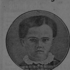
Edison a los 4 años de edad

Las primeras utilidades de la venta las dedicó a establecer dos tenduchos en Port-Huron: uno para la venta de periódicos y otro para la venta de legumbres, huevos y frutas. Este negocio era muy pequeño, pero dejaba algunas utilidades, porque Edison pasaba mercaderías de contrabando en los vagones.