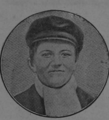
Edison a los 13 años