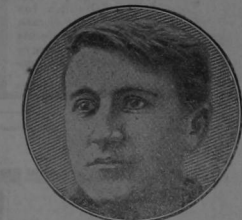
Edison a los 24 años